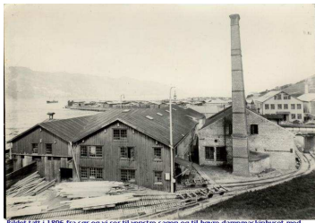
Bildet tatt i 1896 fra sør og vi ser til venstre sageri og til høyre dampmaskinhuset med skorsteinen. Bak bygningene ser vi Nøkken med plankelager bakover på tomte.

Det første Strandheim Brug med pipa fra dampmaskinhuset.